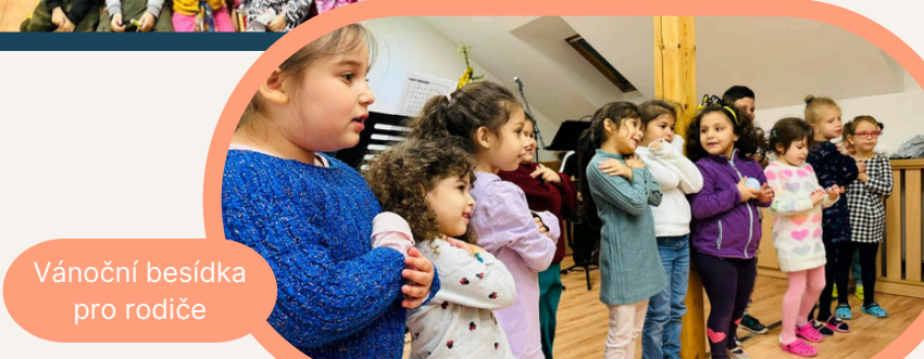
Vánoční besídka pro rodiče