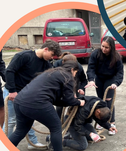
Velikonoční Go camp