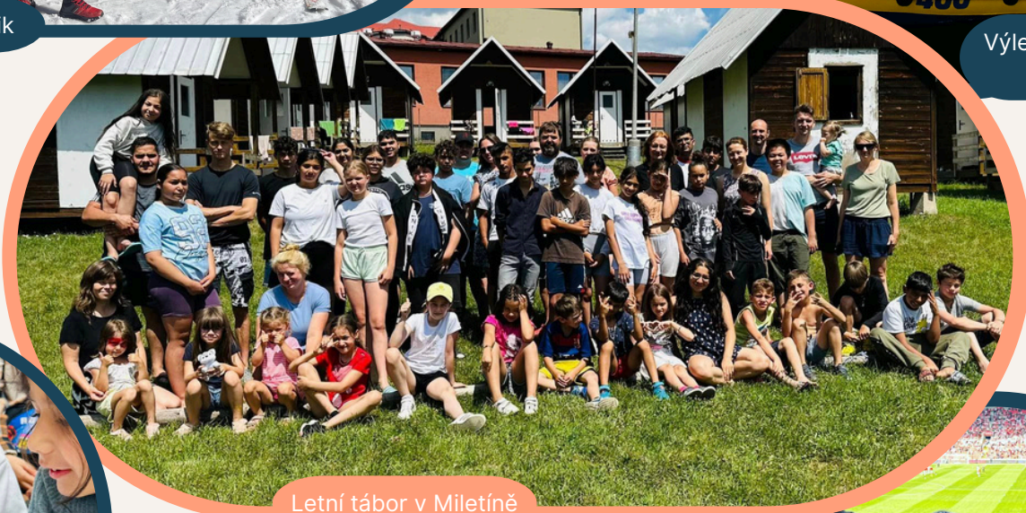
Letní tábor v Miletíně