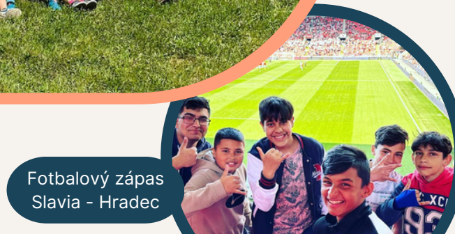
Fotbalový zápas Slavia - Hradec