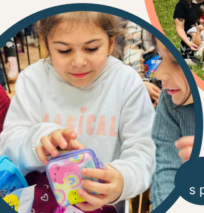
Oslava Vánoc s předáváním dávků