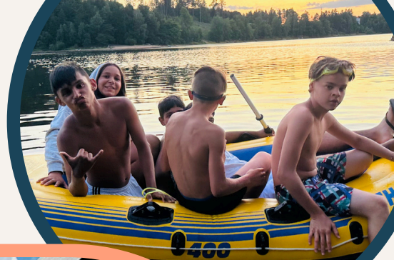
Výlet na sečskou přehradu