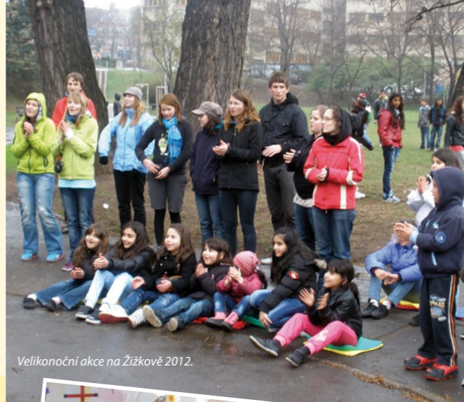
Velikonoční akce na Žižkově 2012.