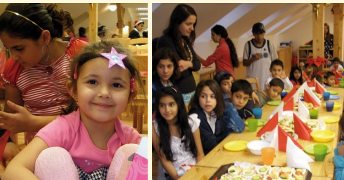
Vánoční oslava v novém domě.