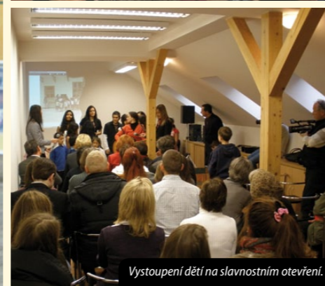
Vystoupení dětí na slavnostním otevření.