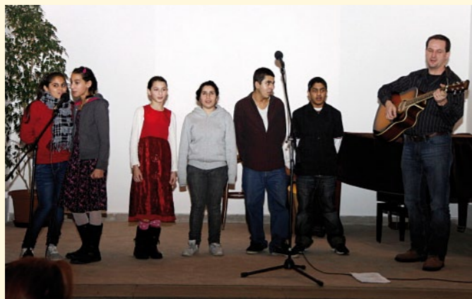
Vystoupení dětí z CDM na slavnostním předání ocenění Dobrovolník roku.

Podobně jako v předchozích letech spolupracujeme s Úřadem Městské části Praha 3 v rámci pracovní skupiny komunitního plánování sociálních služeb. Účastníme se setkání poskytovatelů služeb naší cílové skupiny. Vážíme si ocenění „Dobrovolník roku“, které udělila našim třem dobrovolníkům Městská část Praha 3. Při slavnostním ocenění v prosinci 2012 zazpívaly děti za doprovodu vedoucího centra V. Pohanky několik křesťanských písní včetně jedné v romštině.