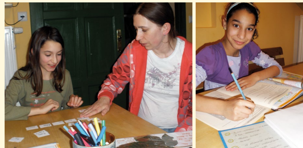
Děti v pěstounské péči se od září 2012 učí v domácí škole.