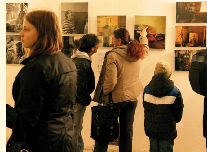
📷 Záběry z výstavy fotografií 📺 V klubu