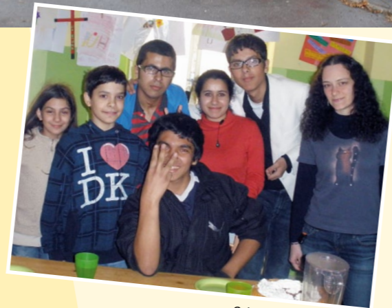
Oslava narozenin jednoho z našich teenagerů.