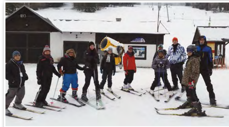
Lyžařský výcvik během jarních prázdnin v Jáchymově v Krušných horách