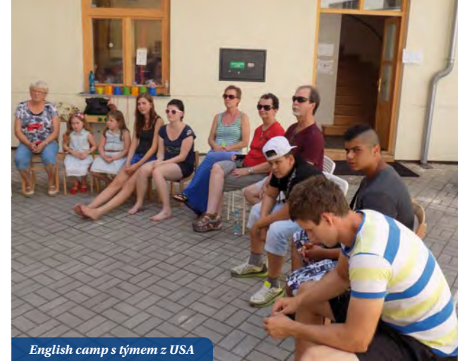
English camp s týmem z USA