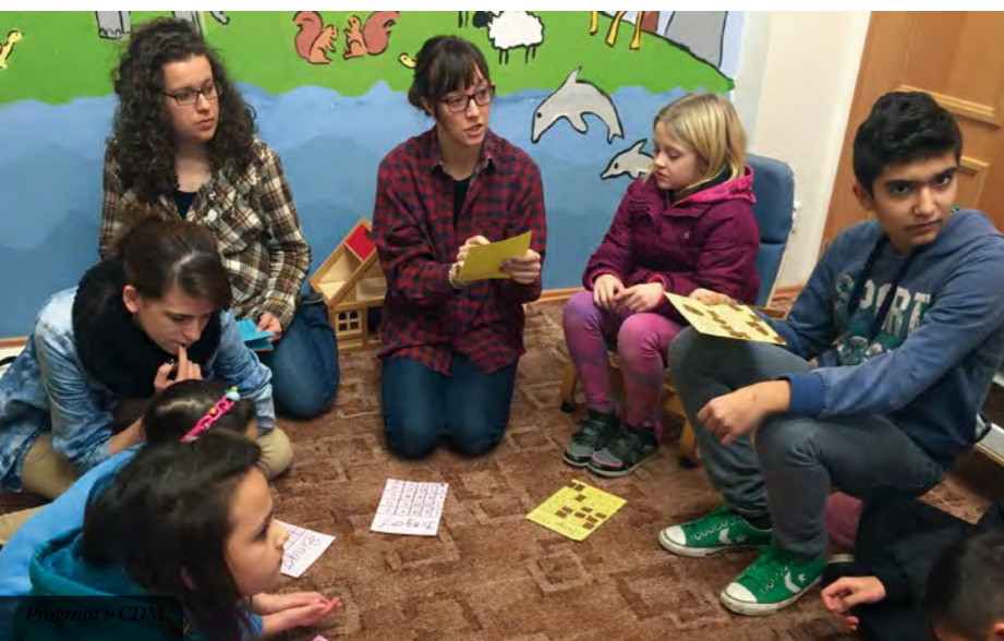
Program v CDM