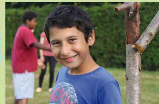
Tábor Seč 1. – 10. 7. 2016