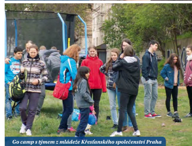
Go camp s týmem z mládeže Křesťanského společenství Praha